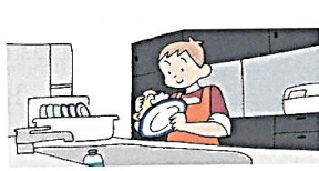
do the dishes ( )