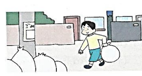
take out the garbage ( )