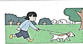
walk the dog ( )

12 あなたは留学生のエリックと、美術館に来ています。日本語を読むことができないエリックに、次の注意書きをどのように説明しますか。考えて書きなさい。