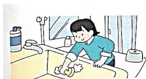
clean the bathroom ( )

11 次の絵の中から2つ選び、その仕事について、あなたがしなければならないかどうかを伝える英文を書きなさい。(表現 各2点)