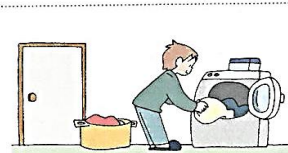
do the laundry ( )